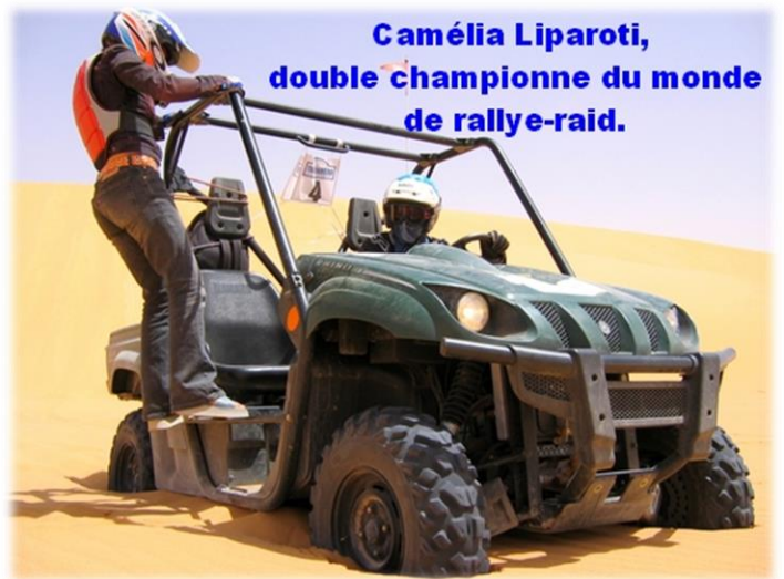
Camélia Liparoti, double championne du monde de rallye-raid.