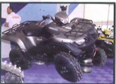
À l'occasion de ce salon, on pouvait découvrir le nouveau coloris du Suzuki 750 Kingquad.