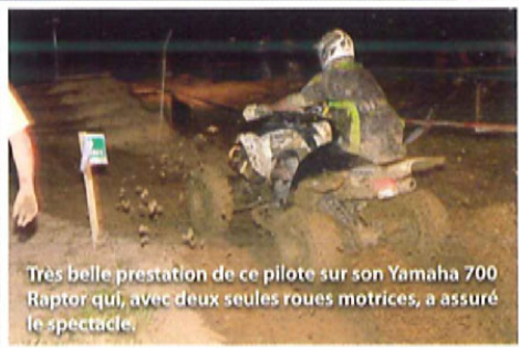
Très belle prestation de ce pilote sur son Yamaha 700 Raptor qui, avec deux seules roues motrices, a assuré le spectacle.