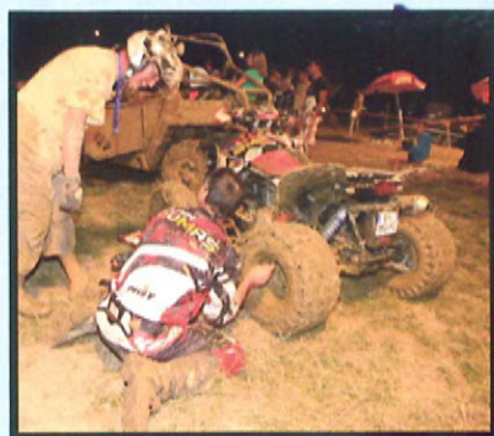
Quand on roule en sportif sur ce genre de terrain, la pression des pneus est primordiale.