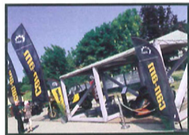
Can-Am mettait en avant ces 3 univers que sont le quad, le SSV et le Spyder.