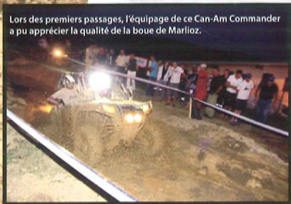
Lors des premiers passages, l'équipage de ce Can-Am Commander a pu apprécier la qualité de la boue de Marlioz.