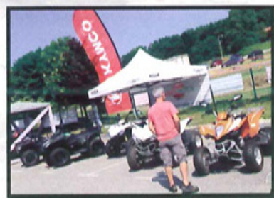
La marque Kymco était représentée par un concessionnaire local.

odeur de sainteté, nous tirons notre chapeau à Monsieur le maire, qui n'a pas hésité à mettre à la disposition de l'organisation une parcelle de terrain pour y tracer un parcours de trial destiné aux quads et SSV. Comme l'année dernière, tous les acteurs majeurs du quad étaient présents, nous citerons par exemple Yamaha, Suzuki, Can-Am, Kawasaki, Hytrack, CF Moto, Yamaha et Polaris, avec une mention particulière pour ces deux dernières marques, qui avaient mis les petits plats dans les grands pour l'occasion. Afin de satisfaire les attentes de tout le monde, une randonnée était au programme, avec différentes boucles sur les deux jours. Cela fera certainement partie des points à améliorer pour l'année prochaine, car dans un souci de ne pas heurter la sensibilité des riverains, cette randonnée d'une quarantaine de kilomètres comportait de trop longues portions de route au goût de certains. Gageons que cela sera différent l'année prochaine. Ce que nous retiendrons de ce week-end, c'est la bonne