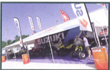
Belle présentation de la gamme Suzuki qui avait fait le déplacement avec la semi-officielle.