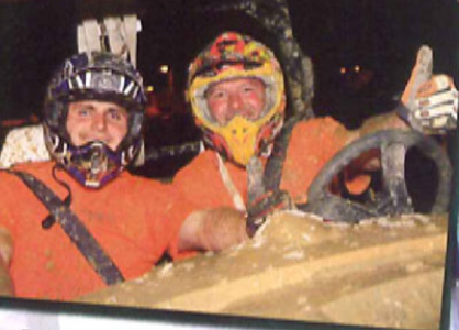
Forcément, quand on s'arrête en plein milieu de la fosse, l'eau et la boue font vite leur entrée dans l'habitacle, ce qui n'a pas l'air d'entamer la bonne humeur des deux amis.