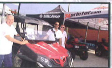
La marque CF Motos avait mis en avant son dernier-né dans le gamme SSV : le ZForce 800.