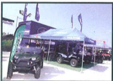
Polaris avait mis les petits plats dans les grands avec une structure digne des plus grands événements.