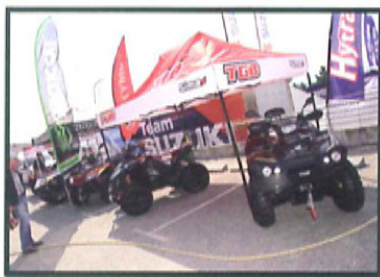
Sous la tente TGB trônait le dernier-né de la gamme Blade équipé de sa direction assistée.