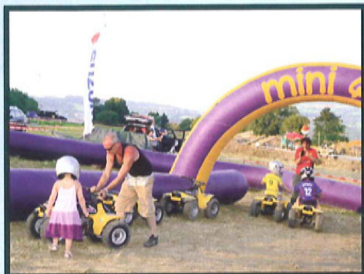
Lors des New Gate Days, il y en avait pour tous les âges.